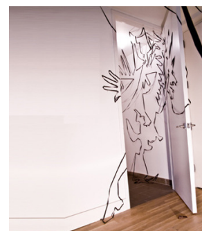
Dhany, 2009, adhésif noir dans l'espace (détail), installation in situ à Artillery pour EyeLevelBQE, Brooklyn, New York