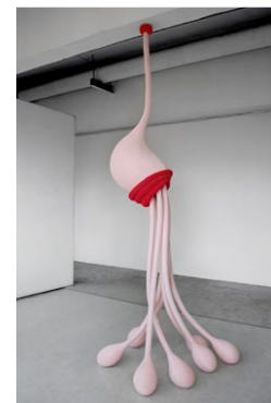
Thrum#3, 2009, technique mixte